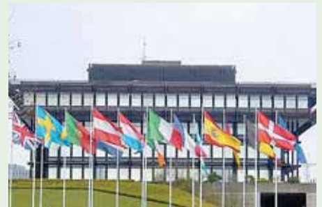
Der Europäische Gerichtshof (EuGH) in Luxemburg.

Bot ist der bisherigen Linie des Gerichtshofes gefolgt, nach der ein ausschließlich staatliches Glücksspielangebot zulässig ist. In seinen europaweit relevanten Schlussanträgen zu zwei niederländischen Fällen macht der Generalanwalt deutlich, dass Lizenzen aus EU-Mitgliedstaaten nicht in anderen Mitgliedsstaaten anerkannt werden müssen.